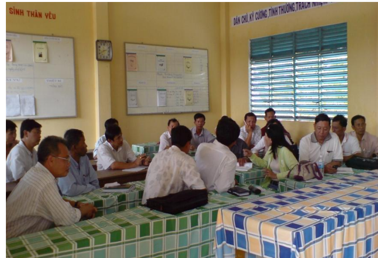
Chia sẻ kinh nghiệm chung