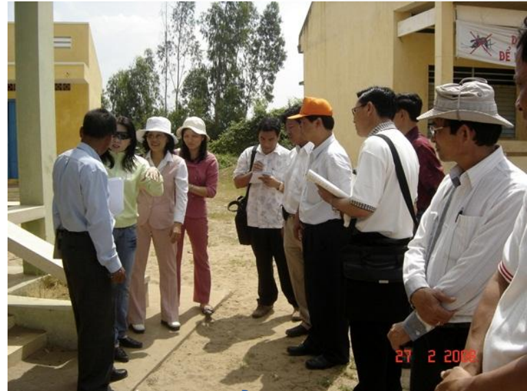
Thăm quan điểm giữ trẻ mùa lũ