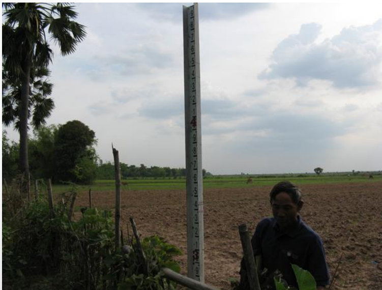
Mùa khô ở Kandal, CPC giống An Giang