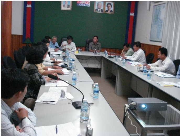
Chia sẻ công tác PCLB tỉnh Kandal