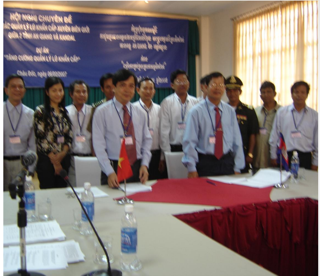
Lễ ký kết thỏa thuận hợp tác xuyên biên giới ngày 6/2/2007