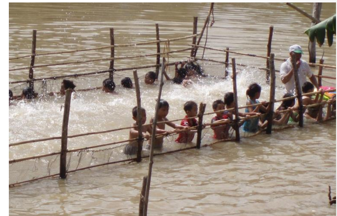
Mô hình dạy bơi trẻ em An Giang