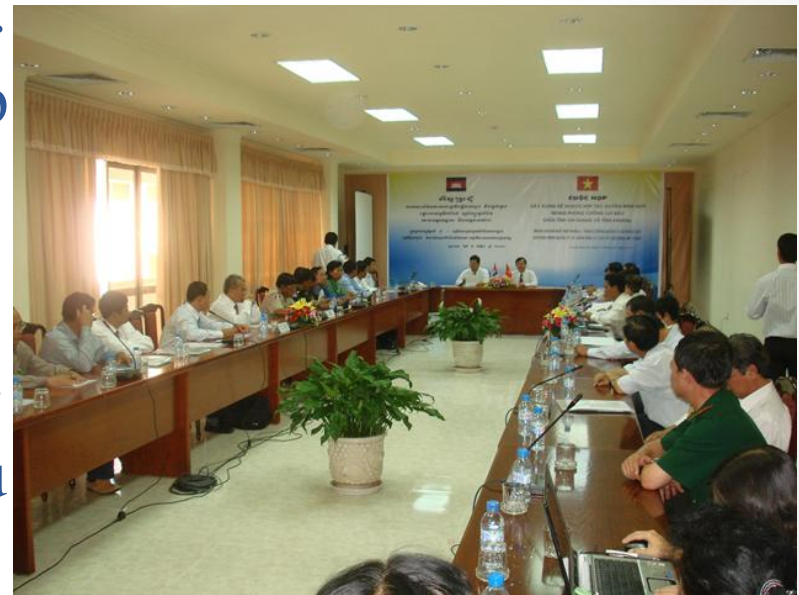
Cuộc họp xây dựng kế hoạch hợp tác xuyên biên giới ngày 5/11/2010 tại An Giang

Năm 2011 Tổ chức diễn tập chung về phòng chống lụt bão & TKCN giữa 2 tỉnh An Giang và Kandal ở cấp huyện, hoặc cấp xã biên giới. Đề nghị Trung tâm phòng chống thiên tai Châu Á (ADPC) trình Ủy hội sông Mê Kông hỗ trợ kinh phí diễn tập chung.