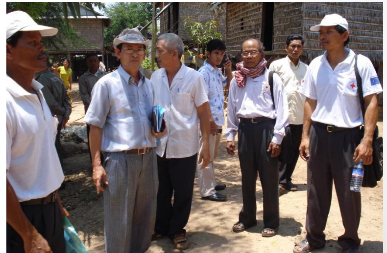
Đoàn AG chia sẻ với chữ Thập đỏ Kandal