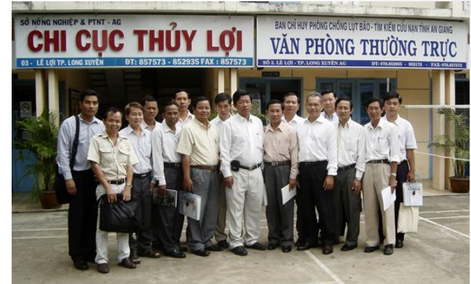
Đoàn công tác Kandal đến An Giang