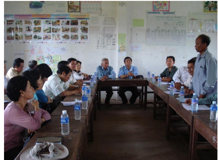
Chia sẻ kế hoạch PCLB cấp xã