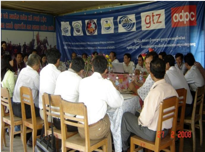
Chia sẻ cứu hộ dọc biên giới