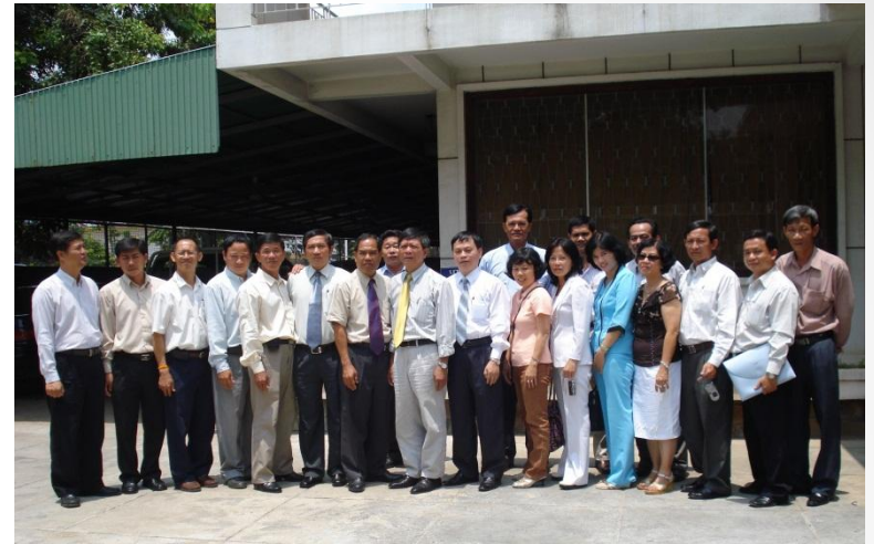
Đoàn công tác An Giang sang kandal