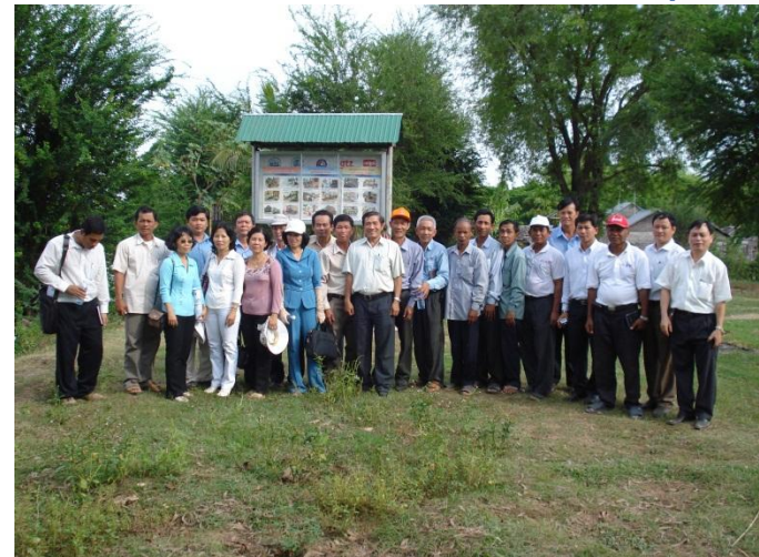
Điểm tạm trú mùa lũ dân CPC