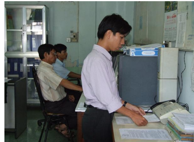
Tiếp nhận, đưa thông tin xuống địa phương