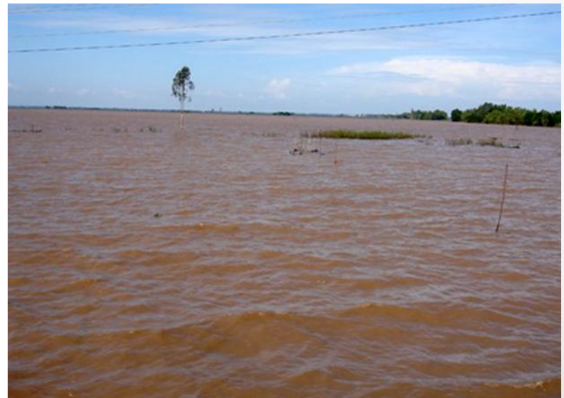
Mùa lũ ở An Giang, VN giống Kandal