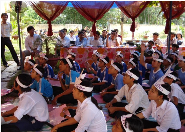
Ngày hội trường học an toàn mùa lũ