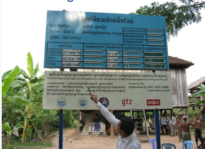
Cảnh báo lũ cho cộng đồng