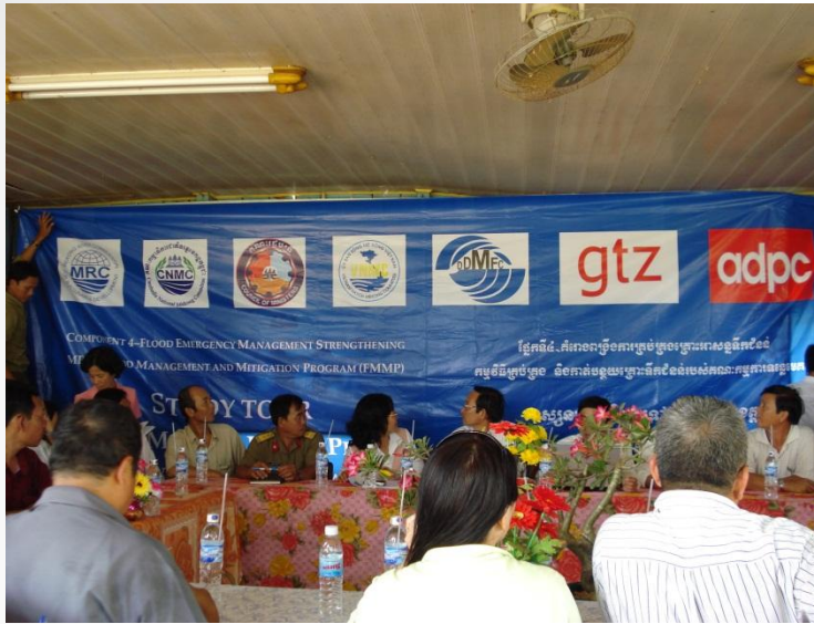
Chia sẻ lập kế hoạch PCLB ở xã