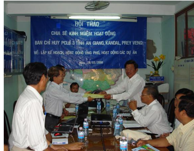
Chia sẻ lập kế hoạch PCLB của AG