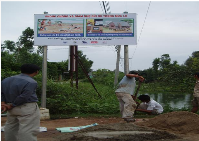
Tuyên truyền bảo vệ trẻ em mùa